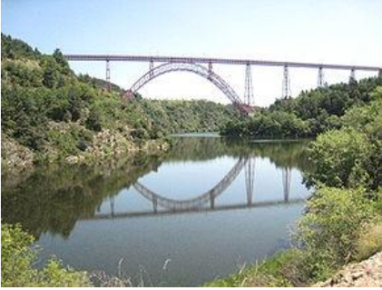
Viaduc de Garabit

Ce bout du monde, c'est là, au pied du village de Saint-Georges, dans le Département du Cantal, où l' Ander se jette dans la Truyère , à quelques kilomètres en amont du Viaduc de Garabit lancé au travers des gorges du torrent par la Société Gustave Eiffel dans les années 1880. C'est ce pont qui permet aujourd'hui aux trains de traverser depuis sa construction à la fin du XIXème siècle.