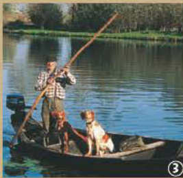
Marais de Nieulet

Frontière entre le Nord et le Pas-de-Calais, le marais audomarois trouve son origine à l'époque Gallo-romaine. La mer s'engouffrait alors jusqu'à Watten et Saint-Omer était un port actif. Suite à l'érosion et aux changements climatiques, la mer s'est retirée et Watten culmine à 72 m d'altitude. De ce point, s'étendent à perte de