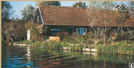
Marais de Nieulet. Habitat traditionnel.