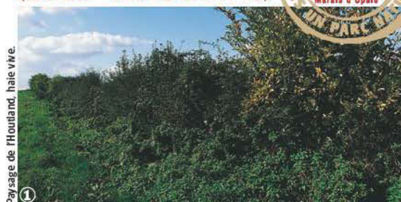
Paysage de l'Houtland, hale vive.