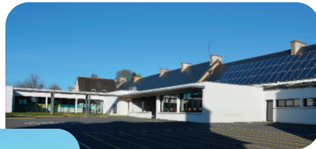
Ecole «Le Petit Prince»

L' « Enfance-Jeunesse » est une des compétences les plus importantes pour une commune. En termes de moyens mais également en termes d'objectifs puisqu'il s'agit de préparer l'avenir de ce qu'une commune a de plus précieux : ses enfants.