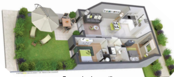
Exemple de pavillon d'un « Village Séniors »

Les services proposés regrouperont une salle de réception commune, une conciergerie, la téléassistance 24 heures sur 24, les dépannages domestiques et divers autres services et animations. Gérée par la Mairie ou un organisme social, les loyers (locataires) ou redevances (propriétaires) permettront d'équilibrer les coûts et d'assurer le remboursement de l'emprunt.