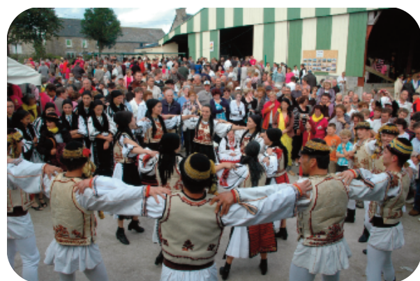
« Groupe folklorique roumain à la Pomme de Terre en Fête 2011 »

Cette personne suivra une série de formation : sécurité, obligations administratives, montage des dossiers de demande de subventions, ... pour venir en appui aux associations. C'est comme cela que nous assurerons la pérennité de nos manifestations.