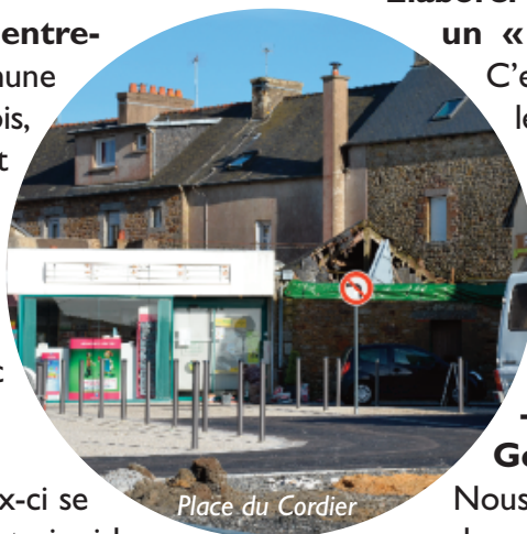
Place du Cordier

- Anticiper les travaux pour éviter que ceux-ci se déroulent au moment des fêtes, pénalisant ainsi les commerçants en plein hiver, alors qu'ils auraient pu être programmés à la belle saison.