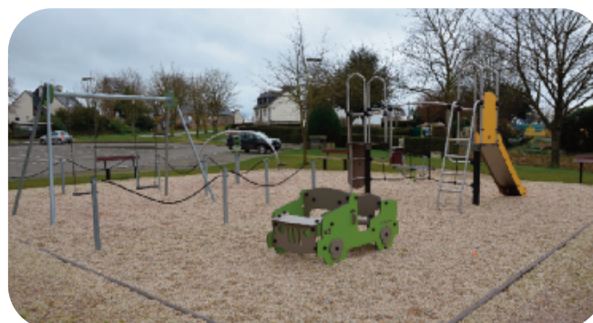
Espace de jeu de la commune de Maroué

Nous souhaitons également créer une aire de jeu pour les enfants : un véritable espace de jeu dans le centre-bourg pour garder la vie dans le centre.