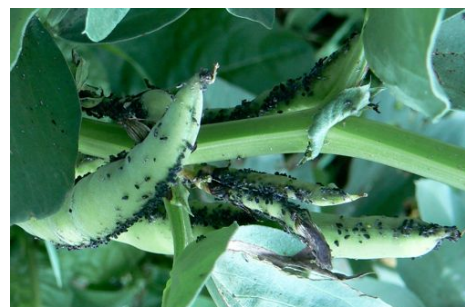
des fèves et des pucerons

Pour les protéger des pucerons, il est intéressant d'associer rosiers et lavandes ; au potager, on pourra lutter contre la mouche du poireau en associant carottes ou fraisiers avec les poireaux.