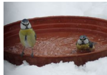
mésanges bleues au bain

Il faut éloigner ces dispositifs des buissons dans lesquels les chats aiment se mettre à l'affût. Selon certaines données consultables sur internet, on estime qu'en une année, 8 millions de chats attrapent 55 millions d'oiseaux en Grande Bretagne et que plus de 1 million de chats attrapent en France plus de six millions d'oiseaux.