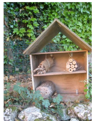
un « hôtel » à insectes