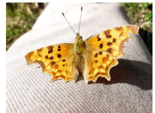
le Robert le diable