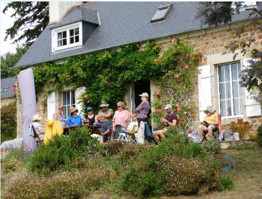
Démonstration sur la terrasse de la maison

Pour ceux qui le souhaite , nous proposons la location partagée d'une maison avec 3 chambres individuelles pour les stagiaires. Cette formule permet de pouvoir se préparer les repas , de partager des moments conviviaux avec les autres stagiaires.