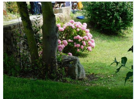
Parc de la maison

La maison dispose d'un grand séjour , d'une terrasse avec vue sur l'anse de la Corderie et d'un beau parc, elle pourra être utilisée également durant le stage en cas d'une petite averse ou pour des temps de convivialité.