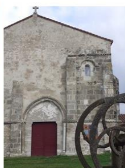
Saint André de Taxat