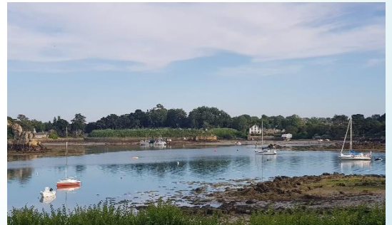
Vue de la maison sur l'anse de la Corderie

La maison disposant d'un grand séjour , d'une terrasse et d'un beau parc pourra être utilisée également pour des temps de stage en cas d'une petite averse ou pour des temps de convivialité.