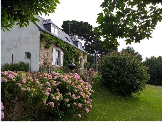
La maison avec un beau parc

Pour ceux qui le souhaite , nous proposons la location partagée d'une maison avec 3 chambres individuelles pour les stagiaires, Cette formule permet de pouvoir se préparer les repas , de partager des moments conviviaux avec les autres stagiaires.