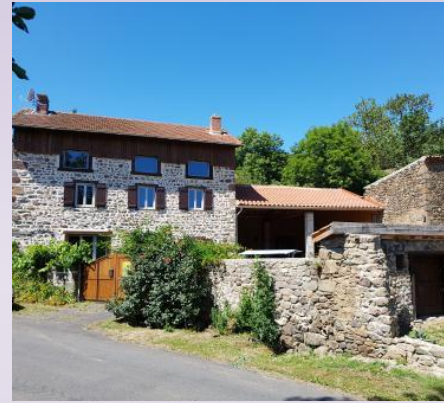
Maison à Domeyrat -43

Pour le repas du soir , chacun peut choisir , rien n'est programmé !