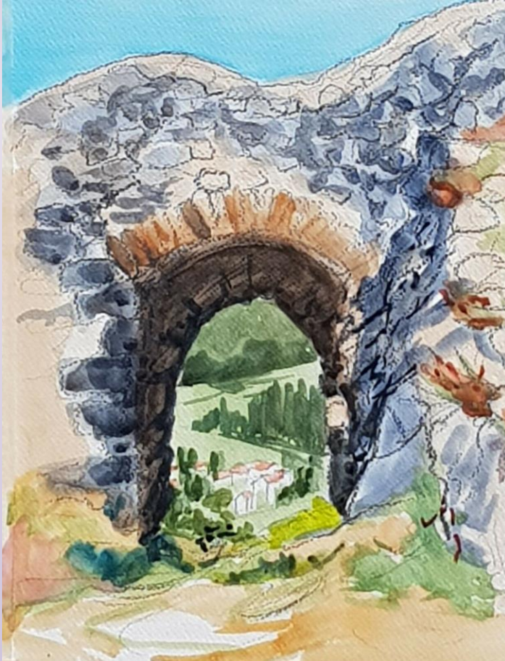
Aquarelle Château de Saint Ilpize- 43

Semaine : du lundi 16 au vendredi 20 Août 2020