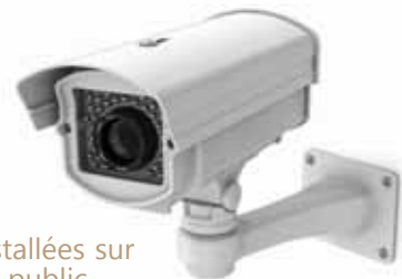
59 caméras installées sur le domaine public