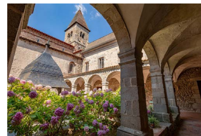
Le prieuré Saint-Julien de Pommiers, propriété du Département de la Loire, se distingue par l'authenticité de la conservation de ses salles médiévales. Le 21 septembre 2021, les membres du Conseil municipal de Pommiers-en-Forez ont approuvé à l'unanimité l'engagement de leur commune dans la candidature.