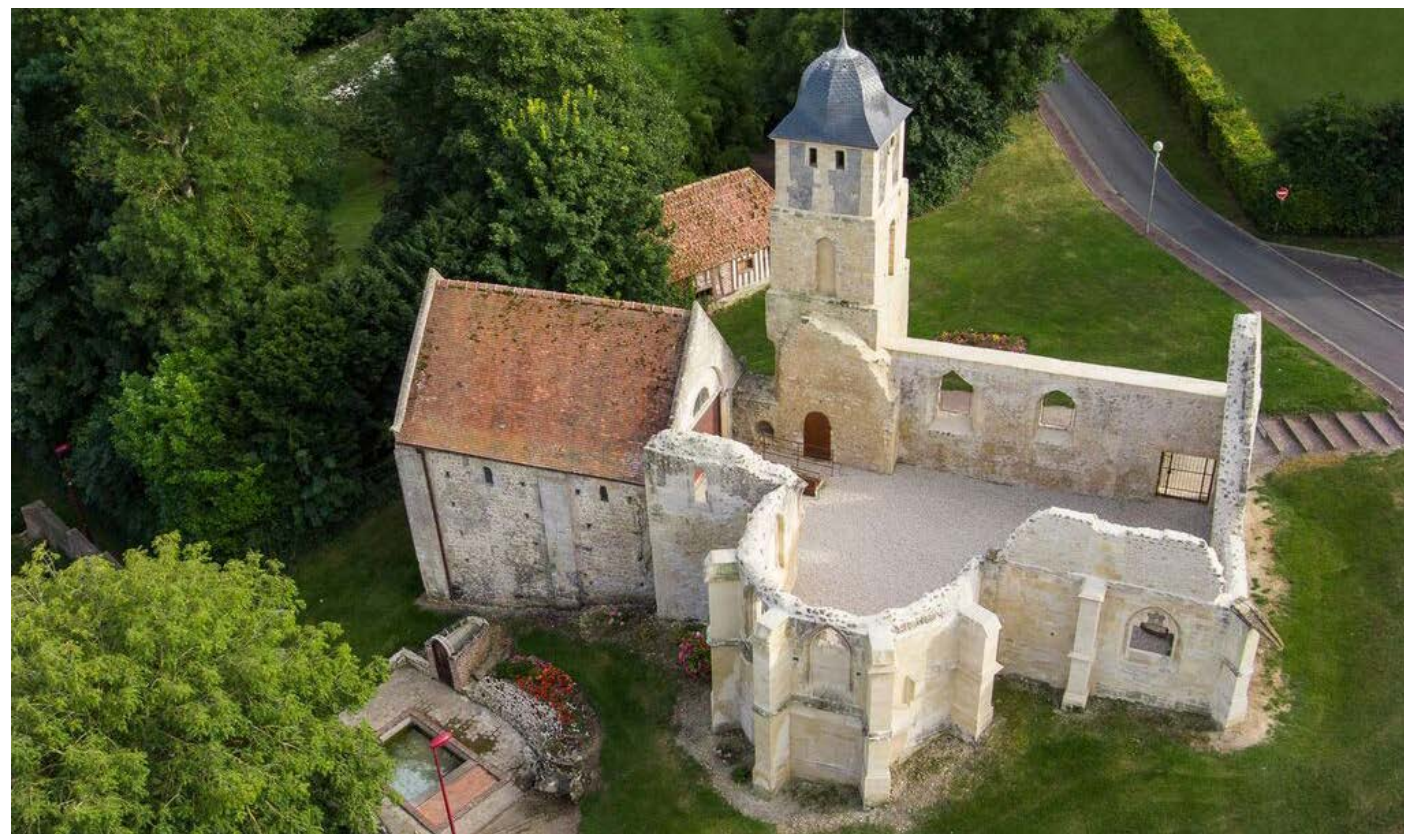
Le prieuré de Saint-Arnould, candidat pionnier du Calvados (France)