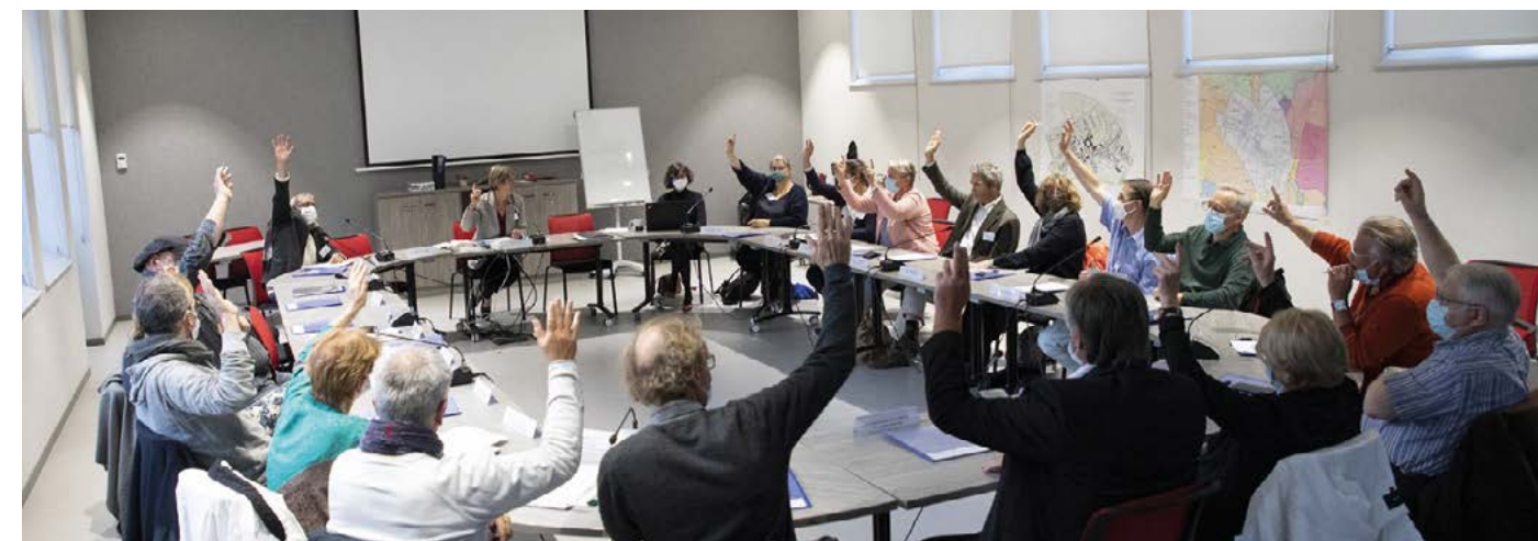
A l'unanimité, les conseillers municipaux de Cluny ont engagé la ville dans la candidature, le 8 octobre 2021