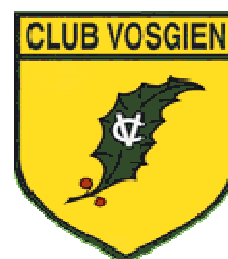
Club Vosgien Colmar

Pour votre sécurité, utilisez la carte au 1:25 000 - IGN-Club vosgien 3719 OT