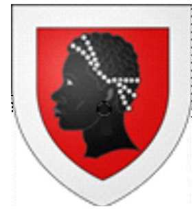
COMMUNE DE NIEDERMORSCHWIHR