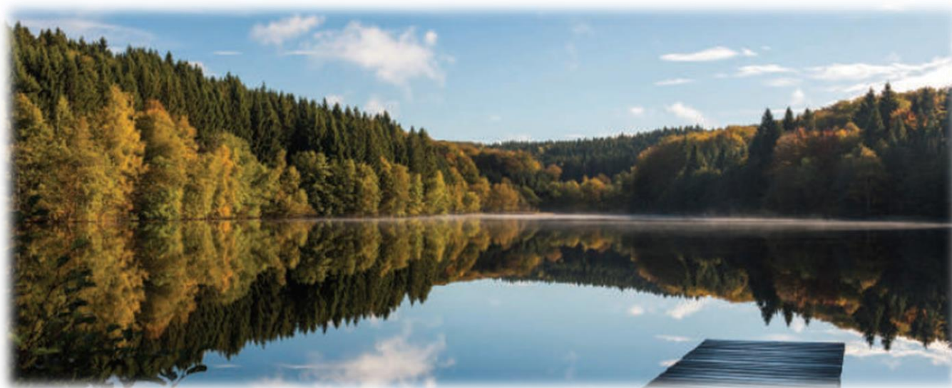
L'étang « Les Viaux-dessus »

De Ronchamp, retour à Colmar en covoiturage.