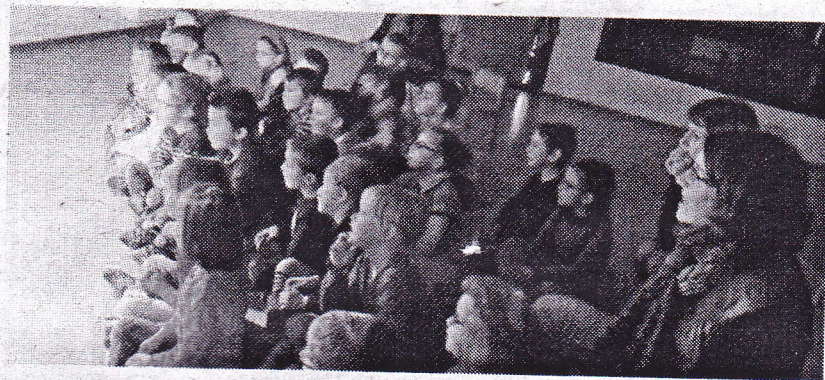
■ Les enfants étaient tout près du grand livre animé.

Les enfants se sont passionnés pour le spectacle. Ils ont accompagné les petits pingouins, en luge sur la neige. En tournant la page du grand livre, ils étaient dans la mer puis au sommet du grand sapin, pour découvrir