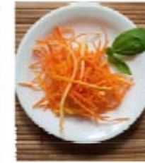
Carottes jaune et orange