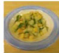
Cubes de concombre