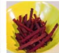
Tagliatelles de Betterave