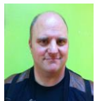
CAUCHET J. CP