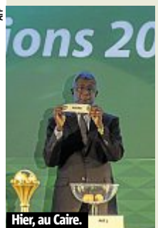
Hier, au Caire.

La CAN retrouve le Gabon. Le pays a été désigné, hier au Caire, pour accueillir la Coupe d'Afrique des nations en 2017. Déjà coorganisateur en 2012 (avec la Guinée équatoriale), le Gabon l'a emporté aux dépens de l'Algérie, aussi candidate malheureuse pour l'organisation des CAN 2019 et 2021, qui n'a plus été hôte depuis 1990.