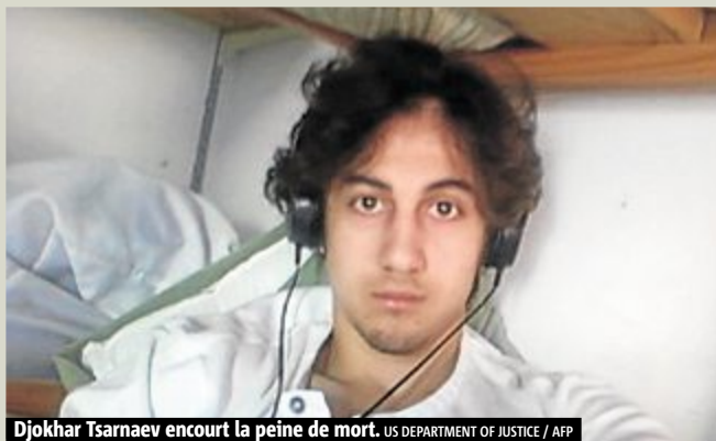
Djokhar Tsarnaev encourt la peine de mort.

Politique. Selon Le Parisien , Nicolas Sarkozy aurait parlé ainsi du président du MoDem. Une sortie qui a indigné les associations mais que l'entourage du patron de l'UMP dément.