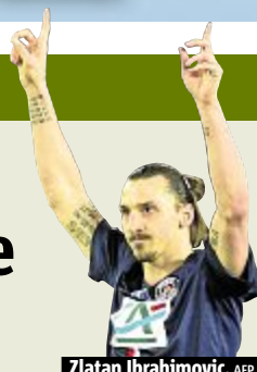
Zlatan Ibrahimovic.