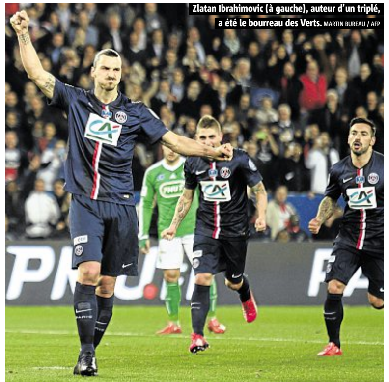
Zlatan Ibrahimovic (à gauche), auteur d'un triplé, a été le bourreau des Verts.

Confrontés à un calendrier démentiel, les hommes de Laurent Blanc n'ont jamais paru fatigués ou désireux de s'économiser. Ils ont immédiatement emballé la rencontre en y mettant beaucoup de rythme, Lavezzi manquant un face-à-face avec Ruffier dès la 4 e minute. Puis, à la 21 e , Ibrahimovic, d'une spectaculaire talonnade, a lancé l'Argentin, déséquilibré dans la surface par Clerc. Et, sans trembler, le Suédois a transformé le penalty et ouvert le score. Mais Saint-Etienne a égalisé