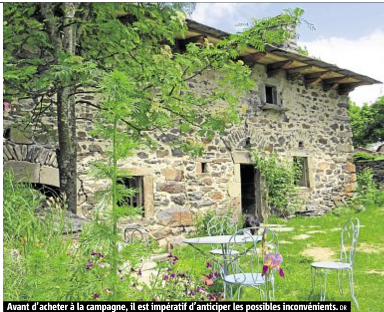
Avant d'acheter à la campagne, il est impératif d'anticiper les possibles inconvénients.

La première question à se poser est celle de la mobilité. Va-t-on accepter de faire beaucoup plus de