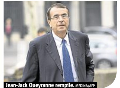
Jean-Jack Queyranne rempile.

pondants au secteur géographique des écoles. La liste des écoles visées par cette grève est consultable sur le site Internet des Villes de Lyon et Villeurbanne.