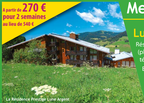
La Résidence Prestige Lune Argent

A partir de 270 € pour 2 semaines au lieu de 540 €