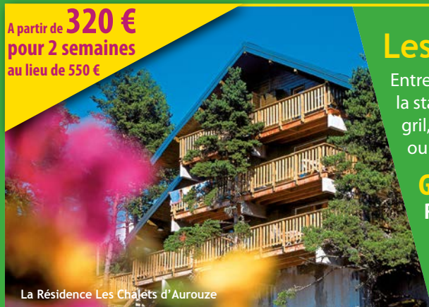
La Résidence Les Chalets d'Aurouze

A partir de 320 € pour 2 semaines au lieu de 550 €