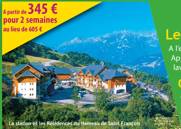
La station et les Résidences du Hameau de Saint François

A partir de 345 € pour 2 semaines au lieu de 605 €