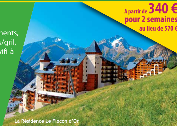
La Résidence Le Flocon d'Or

A partir de 340 € pour 2 semaines au lieu de 570 €