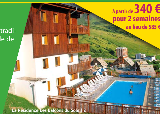
La Résidence Les Balcons du Soleil 2

Randonnée avec accompagnateur (2 demi-journées par séjour)