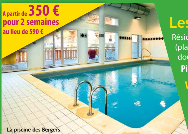
La piscine des Bergers

A partir de 350 € pour 2 semaines au lieu de 590 €