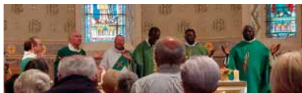
Messe en semaine à Verneix le jeudi 12 octobre