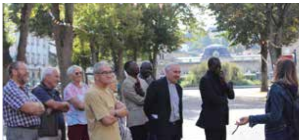
En début de programme : visite guidée de Nérès-les-Bains