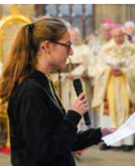
Quelques mots pour accueillir