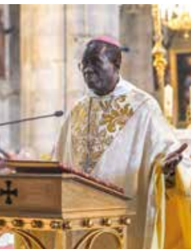
Homélie de Mgr Ndiaye à la cathédrale de Moulines à la messe de clôture du bicentenaire du diocèse