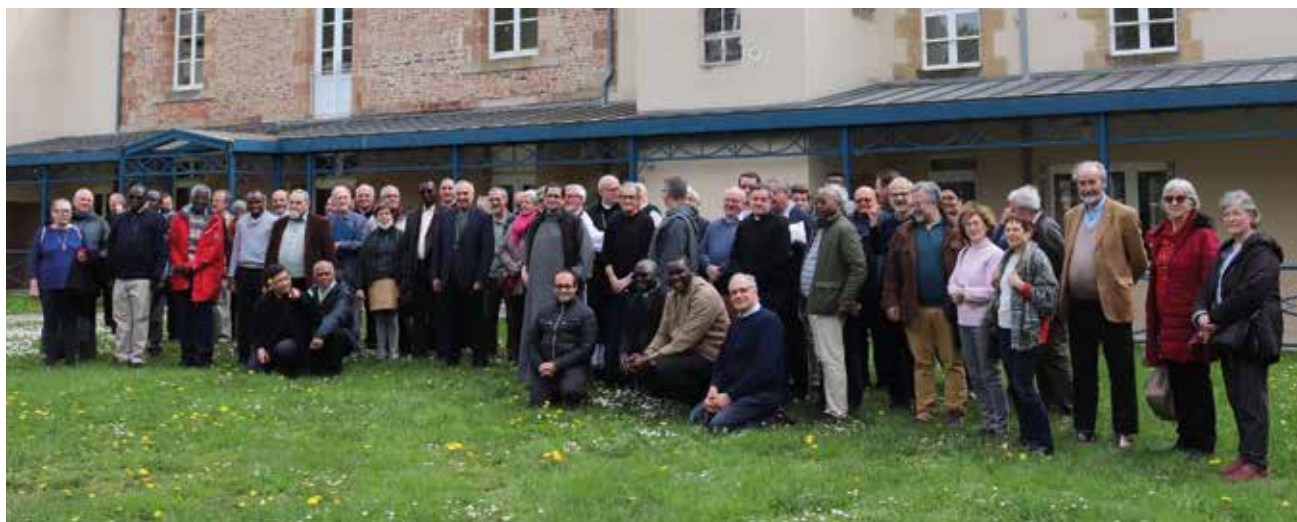
Récollecion des prêtres, diacres, et leurs épouses à la Maison Diocésaine Saint-Paul le 12 avril 2022

Samedi 15 et dimanche 16 avril 2023 Mercredi 26 et jeudi 27 avril 2023 Mardi 9 mai 2023 Jeudi 11 mai 2023 Mercredi 24 et jeudi 25 mai 2023