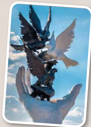
Sculpture : La main de la paix, Kusadasi, Turquie