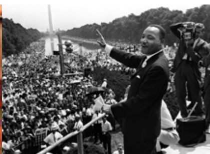
MARTIN LUTHER KING (1929-1968),

Pasteur baptiste noir américain qui revendique de manière non-violente l'égalité des droits et l'amélioration des conditions de vie des Noirs. Il prend la tête du mouvement des droits civiques aux USA. La célèbre marche vers Washington du 28 août 1963 révèle le rêve des Noirs-Américains, celui d'un monde sans discrimination.