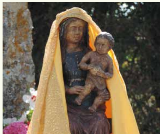
Notre Dame de Chappes portée en procession lors du pèlerinage du 15 août

Messe à 18 h 30 à la chapelle Giraudet (commune de Cressanges). De Cressanges prendre la D 137 (en direction de Moulins) sur 3,5 km puis prendre à gauche (la chapelle est mentionnée sur le panneau), suivre la petite route principale sur 500 m, la chapelle est à droite.