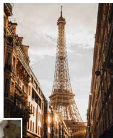
La tour Eiffel à Paris construite en 1889

François Michelin, industriel français (Les Echos, 14 déc.1998)