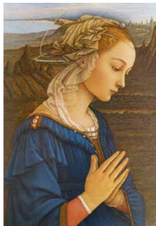
Fra. Filippo Lippi, Vergine delle Rocce

Le modèle qui servit pour peindre Marie est la femme du peintre. Mais elle le devint dans des circonstances plutôt mouvementées et spéciales. Filippo Lippi, orphelin de mère, est confié enfant à un couvent de Carmes par son père. On lui fait prononcer les vœux à l'adolescence, moment où on découvre aussi son génie de la peinture. Des années plus tard, on lui commande un tableau et on lui présente une jeune religieuse comme modèle. Elle aussi, orpheline et placée dans un couvent. Ils tombent éperdument amoureux et, devant leur état de religieux, les amoureux s'enfuient. Poursuivis par les autorités, ils doivent leur salut au mécène Cosme de Médicis qui intervient auprès du pape. Ce dernier les relève de leurs vœux et permet leur mariage. En prenant l'amour de sa vie comme modèle, Filippo Lippi peint une Marie belle, douce, tendre, humaine. Après tout, tout amour vient de Dieu, non ?