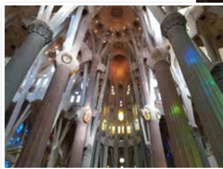
La Sagrada familia, Barcelone, Espagne