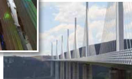
Le viaduc de Millau construit en 2001