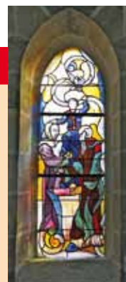
La présentation du Temple, vitrail de Marc Génilloud, chapelle Saint-Joseph, Nérís-les-Bains, novembre 2009.

Après un rassemblement à 15 heures et un envoi depuis l'église Saint-Georges, le parcours traverse Nérís vers le pavillon du lac, puis monte vers la colline pour un moment de prière suivi d'un verre de l'amitié. Grâce à des bénévoles, la chapelle est ouverte les après-midi durant toute la période de cure. Nombreux sont les promeneurs qui viennent en ce lieu paisible pour se recueillir et confier à saint Joseph leurs intentions.