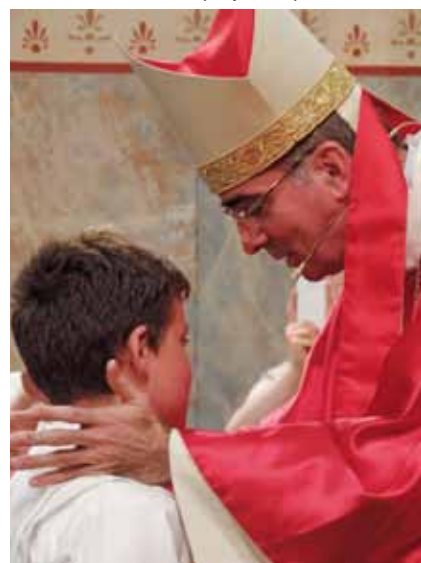
Le dimanche matin, Mgr Percerou prenait le temps de dire quelques mots à chaque jeune qu'il confirmait.