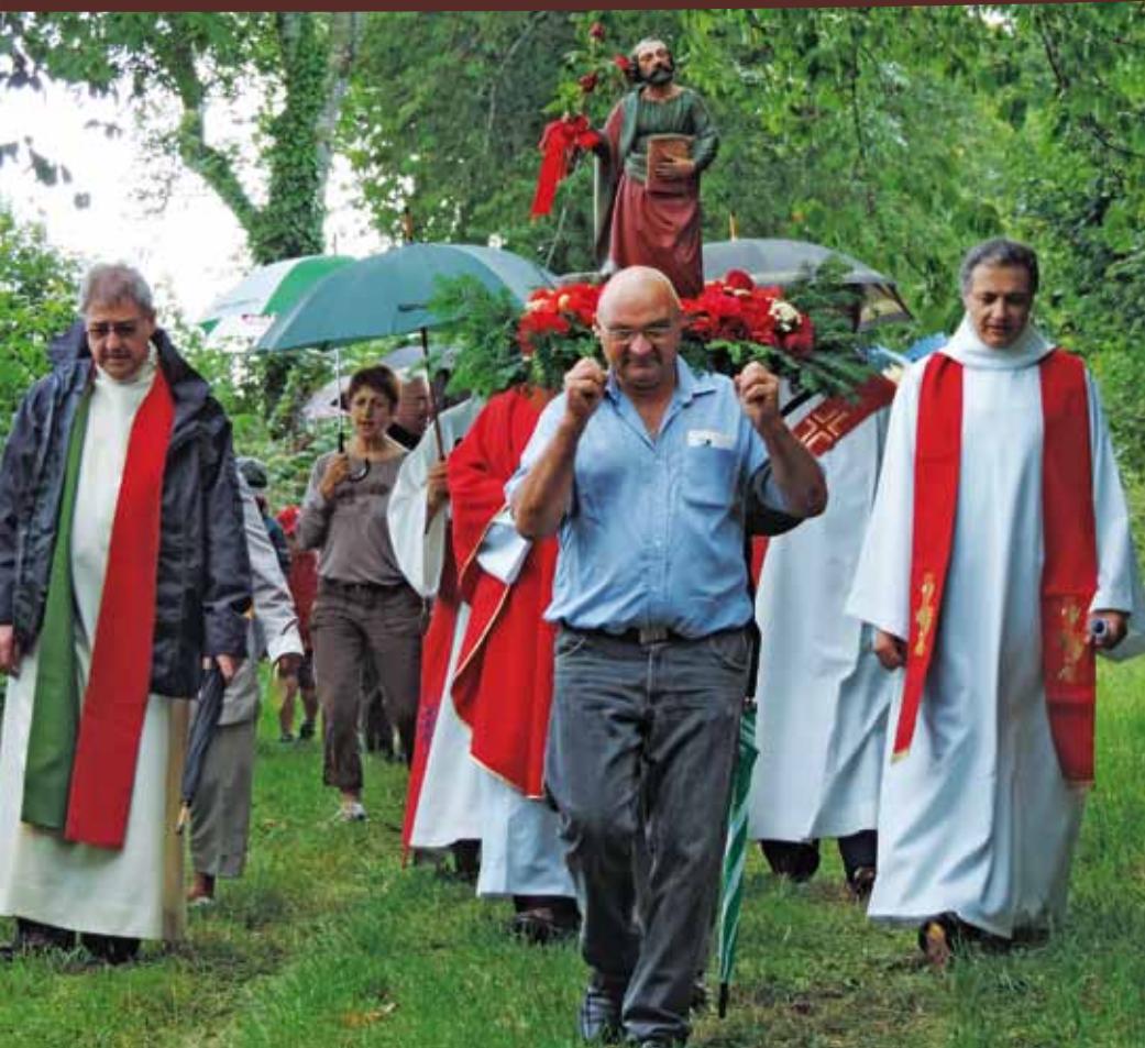
Fête de la Saint-Pierre à la chapelle de La Ronde