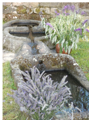
Fontaine de Saint Patrocle à Colombier