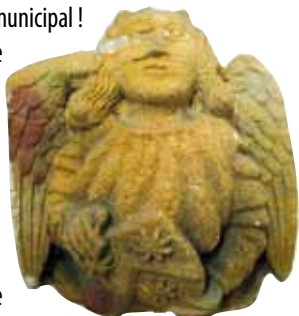
Un des culots sculptés avec le blason de la famille Seguin

Sous le porche, on peut voir quatre culots sculptés provenant d'une chapelle seigneuriale de l'ancienne église. Sur trois d'entre eux les anges présentent le blason de la famille Seguin du Bouchat. À signaler que l'un des trois blasons est un peu différent puisque la troisième étoile est remplacée par un besant, ceci semblant indiquer que l'un des ancêtres de cette famille a pu participer à une croisade.