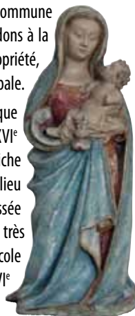
Vierge à l'Enfant (XVI e s.)

Parmi le mobilier, il faut signaler la magnifique Vierge en pierre polychrome (premier quart du XVI e siècle). Autrefois placée à l'extérieur dans une niche sur le mur de clôture de la place, elle fut mise en lieu sûr en 1956 avant d'être restaurée à Paris et classée monument historique en 1958. Cette statue est très représentative de ce que l'on peut appeler « l'école bourbonnaise » de la fin du XV e et début du XVI e siècles. Deux statues de saint Bonaventure et de saint Roch méritent également le détour.