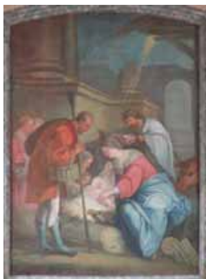
L'Adoration des Bergers (1759)

✓ Outre ces sculptures, l'église de Saint-Angel conserve quelques mobiliers intéressants : dans le clocher une cloche portant la date 1452 (classée MH en mars 1938) ; un tableau de 1759 représentant l'Adoration des Bergers , signé François Finet, peintre creusois qui exerçait à Aubusson.