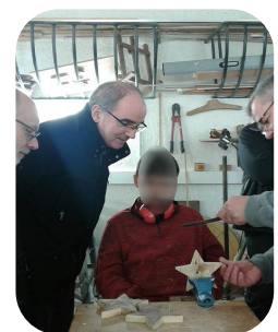
Monseigneur PERCEROU à l'IME de Neuville