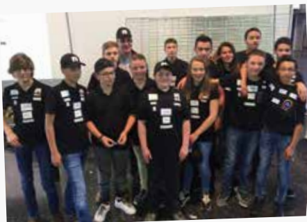
Exposciences à Athanor