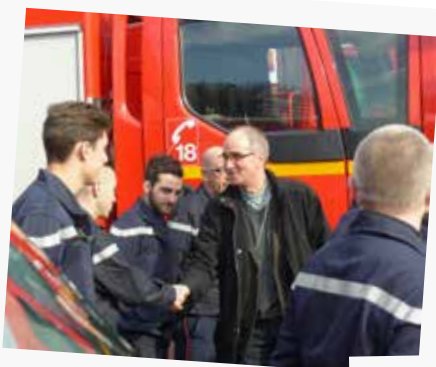
A la caserne de pompiers à Marcillat