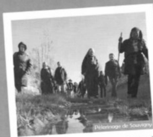
le donne au Denier pour permettre à mon Eglise d'être sur tous les terrains

Toutes les réponses sur www.mchocomsoudenier.fr