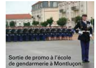
Sortie de promo à l'école de gendarmerie à Montluçon.