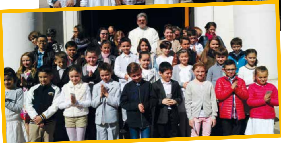
Les enfants de la paroisse ont fait leur première des communions en deux fois (les messes du week-end du 10 avril et celles du 8 mai).

Une cinquantaine de jeunes paroissiens se sont préparés à recevoir le sacrement de confirmation.