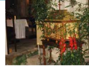
Reliquaire de St Patrocle à Colombier

Il sert à exposer les reliques à la piété des fidèles, soit dans l'église ou lors de processions. Il est alors porté sur des brancards pour être bien exposé à la vue des fidèles. Le reliquaire peut aussi proposer des objets plus anciens et plus précieux encore : les morceaux de la croix du Christ ou de la couronne d'épines de la crucifixion (à