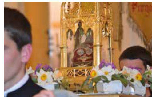
Reliquaire de Saint Odilon et St Mayeul à Souvigny.

aujourd'hui Editeur Bayard Service Edition Centre-Alpes Savoie Technolac - BP 20308 - 73377 Le Bourget du Lac cedex - Tél. 04 79 26 16 60 bse-centre-alpes@bayard-service.com - www.bayard-service.com FABRICATION : Caroline Mazzacane SECRÉTAIRE DE RÉDACTION : Leïla Oufkir CONCEPTION GRAPHIQUE : Karine Moulin MAQUETTISTE : Nadège Landrè RÉGIE PUBLICITAIRE : Bayard Service Régie Tél. 04 79 26 28 21 Impression : Imprimeries Decombat 63363 Gerzat - Dépôt légal : à parution - ISSN 1957-8792 Crédits photos : Aujourd'hui, sauf mention contraire.