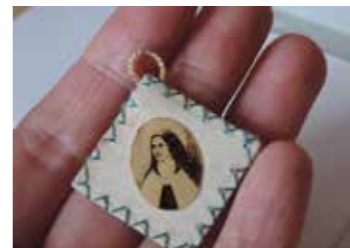
petit reliquaire personnel.

Notons que les reliquaires ne sont pas le propre de la religion chrétienne, juive ou musulmane ; il y a des reliquaires bouddhiques, africains et même profanes (on y conservait le cœur des rois sous l'Ancien Régime par exemple ou bien les boucles de cheveux de certains artistes... Mais rien à voir avec la sainteté)