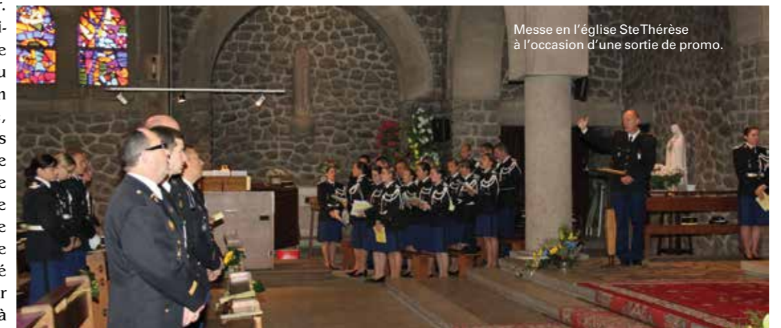
Messe en l'église SteThérèse à l'occasion d'une sortie de promo.