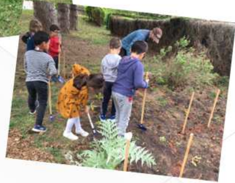
au CLM de Maillecourt