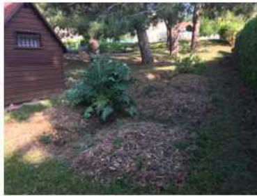
au CLM de Maillecourt