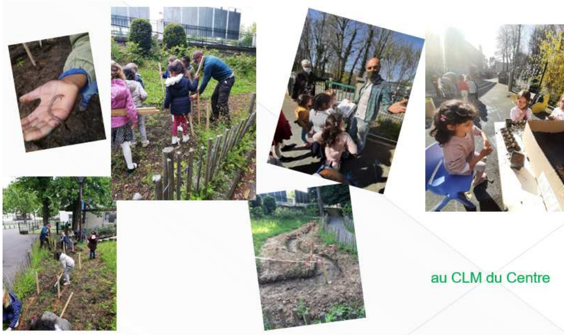
au CLM du Centre