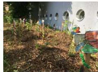
au CLM de Mondétour