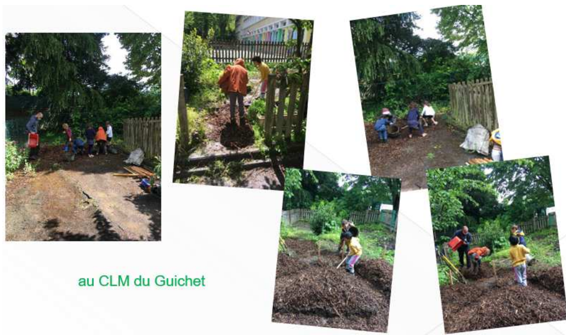
au CLM du Guichet