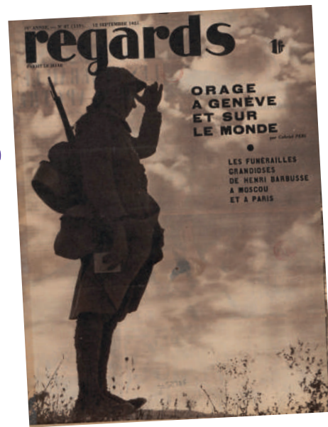
Regards, 12 septembre 1925

À Genève, la Société des Nations condamne l'agression mais se montre incapable de l'arrêter. Les sanctions économiques adoptées contre l'Italie fasciste sont tardives et limitées, tandis que les grandes puissances européennes se refusent à des sanctions militaires.