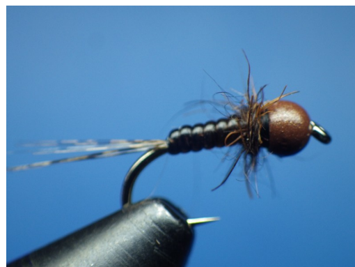
4. Faire une mèche avec le dubbing de lièvre XL afin de former le thorax. Nœud final. Nympe terminée.