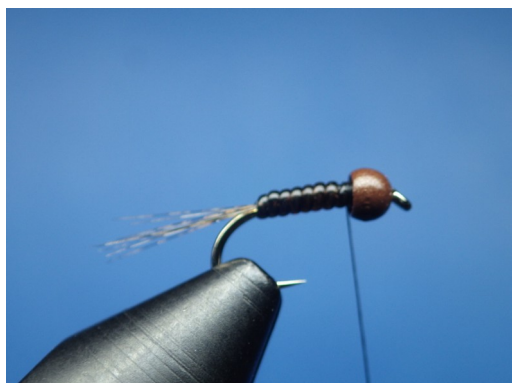
3. Après avoir fixé le micro D-rib, enrouler celui-ci jusqu'à la bille en le tendant au maximum au début et en relâchant la tension au fur et à mesure des enroulements.