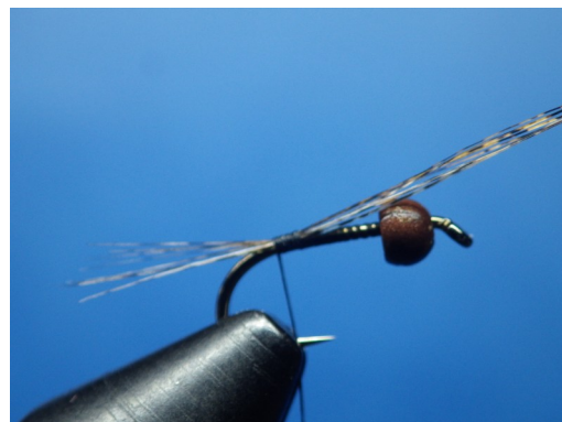
2. Fixer les cerques en coq pardo à la courbure.