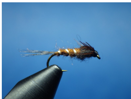
5. Former une mèche avec le dubbing gris microfin et former le thorax. Rabattre ensuite le faisán pour figurer le sac alaire en prenant soin de séparer les pointes en 2 parties égales. Fixer le tout en maintenant bien les pointes vers l'arrière. Nœud final.