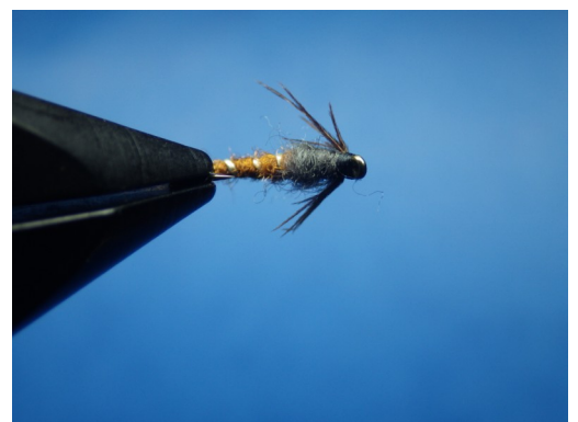
6. Mouche terminée. Vue de dessous pour voir les pattes de la nymphe.