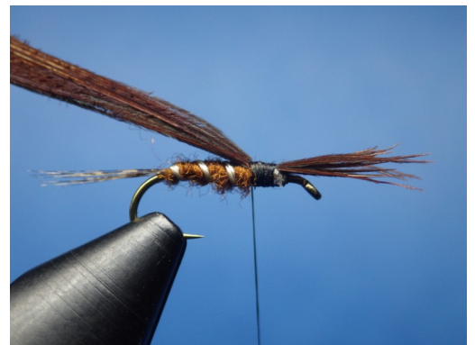
4. Fixer une bonne pincée de fibres de queue de faisán. Laisser dépasser les pointes comme sur la photo.