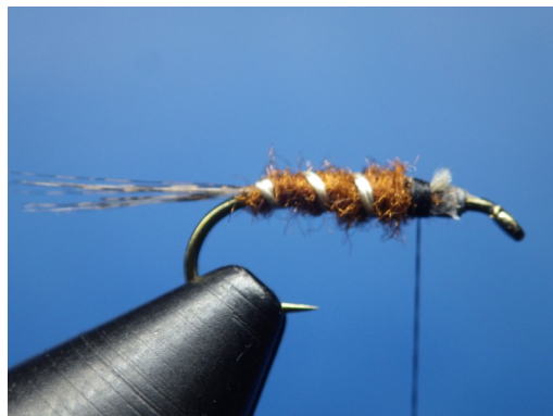
3. Enrouler la mèche pour former l'abdomen et le cercler avec le fil crème. Couper l'excédent de fil crème.