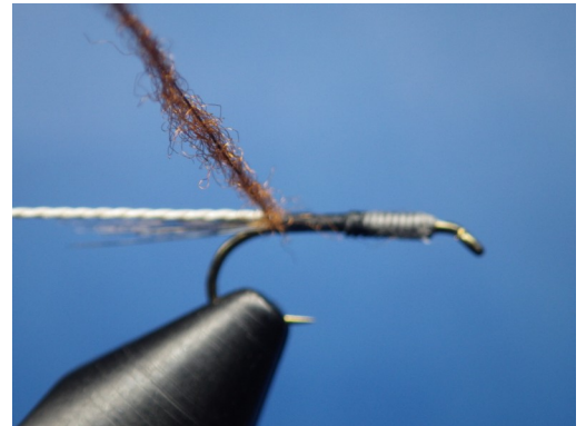
2. Fixer ensuite le brin de fil crème et former une mèche de dubbing antron rouille.