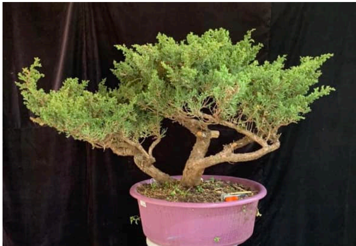
L'arbre au départ