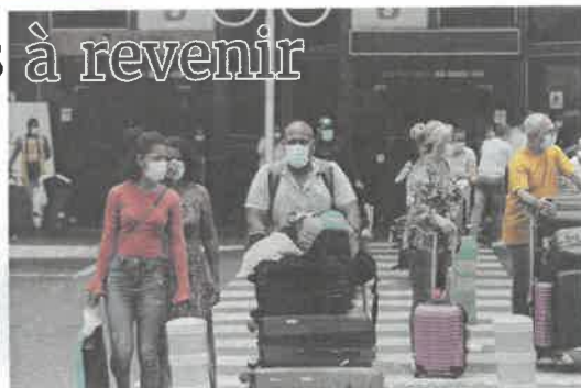
Le renforcement du contrôle des motifs impérieux semble s'accompagner de quelques couacs dans la masse de dossiers à traiter.

"Le numéro que vous essayez de joindre est occupé, veuillez essayer ultérieurement" est également la seule réponse obtenue au cours de nos tentatives, comme pour de nombreux usagers à en croire les commentaires sur les réseaux