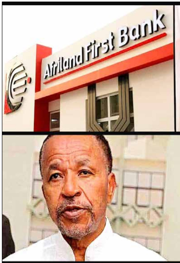
disposant pas de compte dans la zone Cemac, « la Banque des États de l'Afrique centrale (Beac), institut d'émission

En effet à en croire Jeune Afrique économie, « le deal a été conclu depuis juillet 2020 dernier avec pour un montant avoisinant les 30 milliards de FCFA ». Le fruit de la transaction, selon l'accord entre les parties, devait être alors versé sur l'un des comptes d'Afriland First Group. Toutefois, cette holding de droit Suisse ne