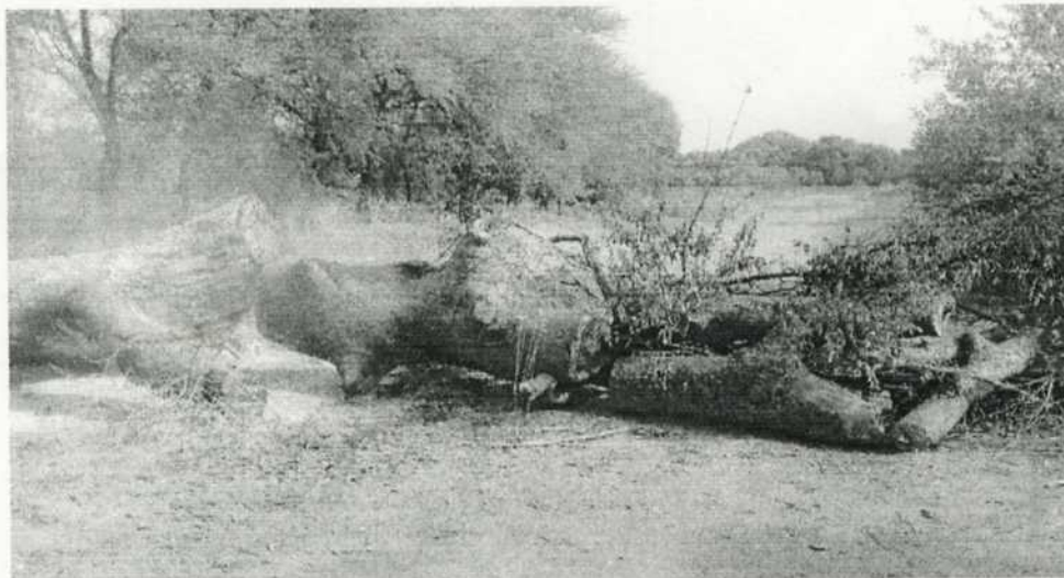
Barricades érigées par les populations de Toul pour empêcher le passage du convoi des bœufs vers Deli.