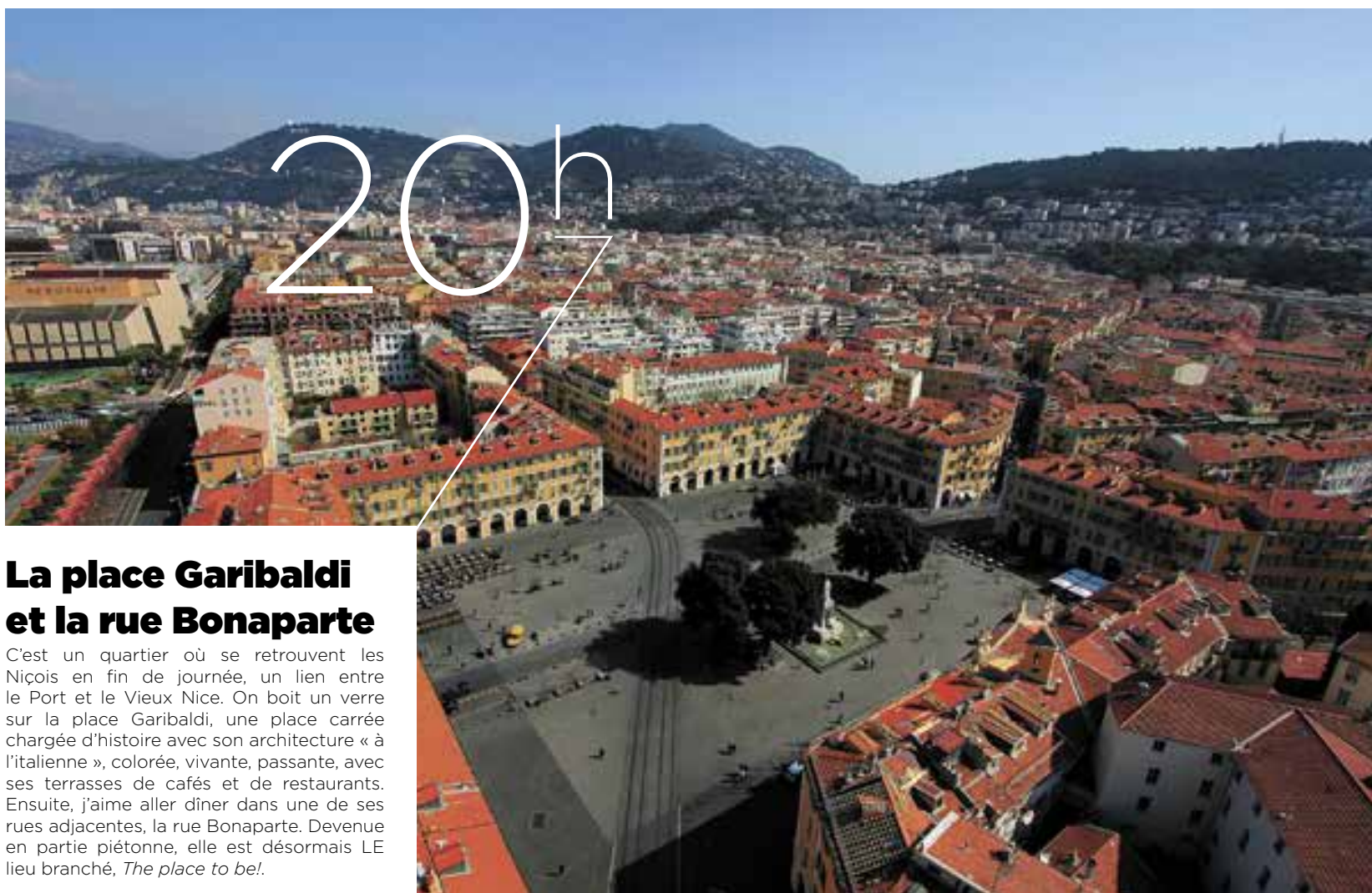
© A vol d'oiseau - Pierre Behar