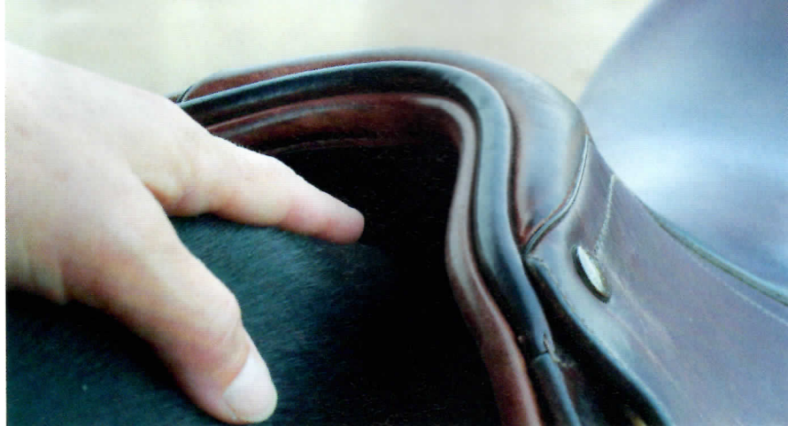
Sur le cheval, sa forme doit impérativement laisser « respirer » le garrot.