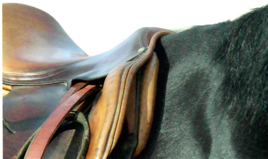
L'exemple type d'une selle très mal adaptée au cheval : elle touche le garrot.