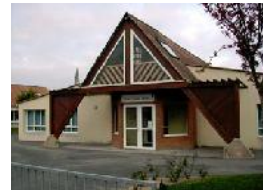
Ecole Ste Marie