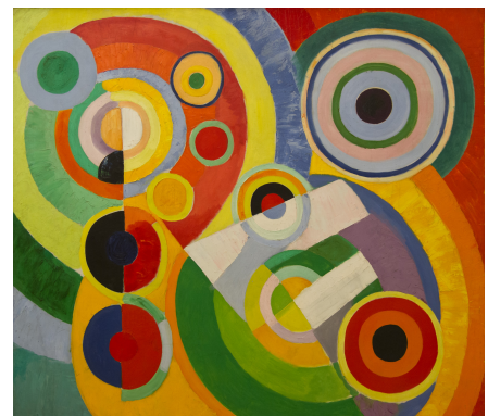
Rythme, Joie de vivre