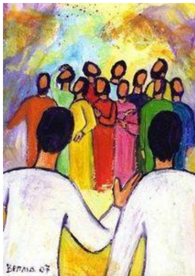
Peinture Berna – Evangile et Peinture

2. Fils du Dieu vivant, ouvre notre cœur, Pour mieux accueillir ta Grâce et ta Lumière. Fais grandir la foi de tous les croyants, Source d'espérance, Jésus Christ Sauveur !