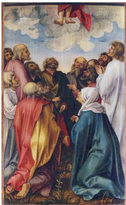
Hans Von Kulmbach (1480-1522)

« Le Verbe s'est fait homme pour que nous devenions Dieu; il s'est rendu visible en son corps pour que nous nous fassions une idée du Père invisible ; il a supporté les outrages des hommes afin que nous ayons part à l'immortalité. » (Saint Athanase d'Alexandrie, Père de l'Eglise universelle)