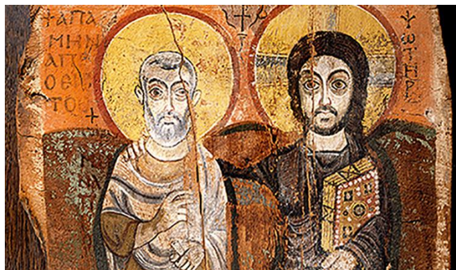
L'ami du Christ (le Christ et saint Mina. 6e siècle à partir de l'icône de Baouit, Egypte, maintenant au Louvre).

De nos fenêtres ou de nos balcons, en ce temps exceptionnel, nous avons observé le printemps, le renouveau de la nature. Le temps pascal, qui arrive au printemps, est le temps du renouveau de nos cœurs où nous observons tout ce qui est beau, fraternel et innovant autour de nous. C'est le moment de sortir de la routine et de revoir notre manière « d'être en relation », d'être en amitié avec la nature, avec les autres et même avec Dieu.