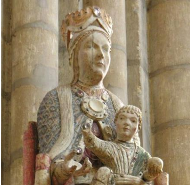
La Vierge à l'Enfant, dite Notre-Dame de la Carole. 12 ème siècle, Basilique Cathédrale de Saint Denis, détail.

Toi qui as porté dans ta chair, le Fils de Dieu, Vierge Marie, Veille avec nous pour son retour : que nous vivions de son amour