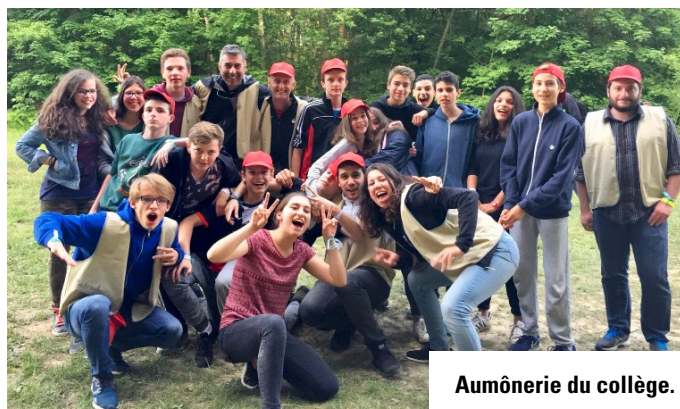
Aumônerie du collège.