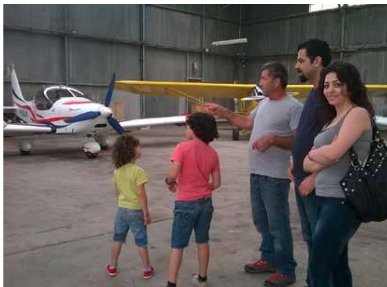
le messager du Raincy

Un projet est en cours sur le site où ils résident et ils ne pourront pas rester dans le logement généreusement prêté par la municipalité.