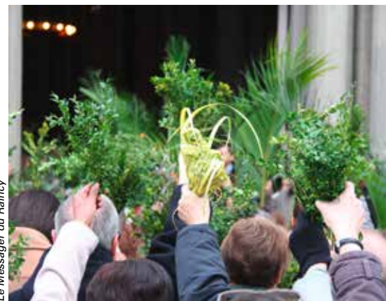
Le Messenger du Raincy

Nous entrons dans la « Semaine sainte » avec la fête des Rameaux (entrée de Jésus à Jérusalem). Au cœur de cette semaine, il y a le Triduum Pascal, qui commence le jeudi soir : Jésus réunit ses apôtres pour le repas de la Pâque (la Cène). En offrant le pain et le vin (rite issu de la Pâque juive), il fait l'offrande symbolique de sa vie (par son corps et son sang). C'est l'institution de l'Eucharistie (la messe). Le vendredi, après une nuit de prière et son arrestation, Jésus est condamné puis mis à mort sur la croix puis déposé dans un tombeau. Le troi-