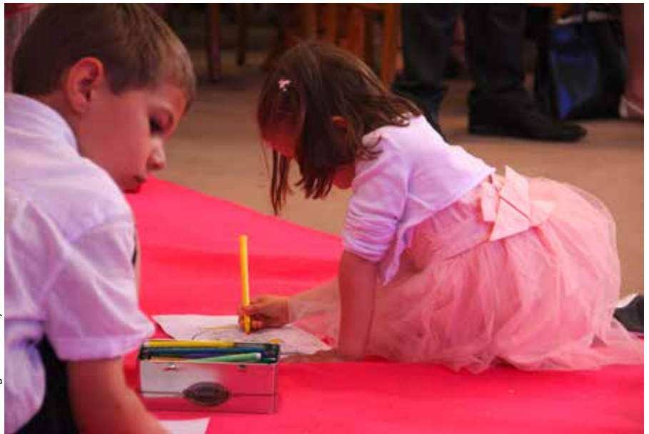
Le Messager du Raincy

Nous débutons chacune de nos célébrations par le signe de croix, ce qui n'est pas facile pour un enfant de trois ans. Un premier rituel important pour commencer à capter l'attention des enfants et leur demander d'ouvrir leur cœur. Pendant chaque séance, nous leur parlons de Dieu avec des mots simples au travers de projections et d'ateliers créatifs. Les projections sont de beaux moments d'échanges: chaque enfant s'exprime, y va de son commentaire parfois drôle, pose des questions simples mais auxquelles il n'est pas toujours facile de ré-