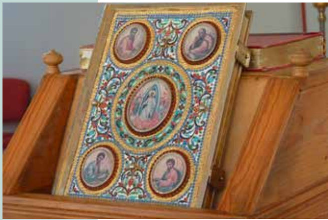
le messager du Raincy

Évangélaire de l'église syrienne de Montfermeil sur lequel on reconnaît en médaillon les quatre évangélistes, Luc, Marc, Matthieu et Jean entourant celui du Christ.