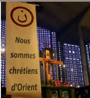
le messenger du Raincy