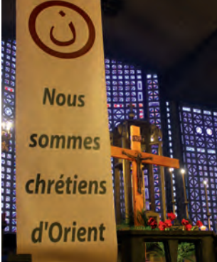
Bannière dans l'église Notre-Dame du Raincy.