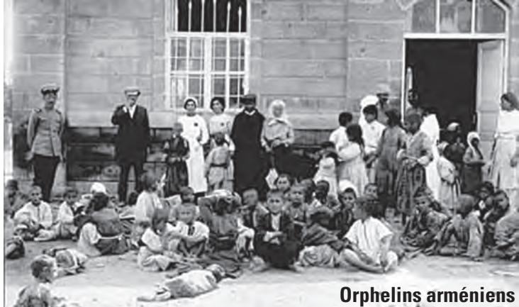
Orphelins arméniens à Vagharshapat (été 1915).