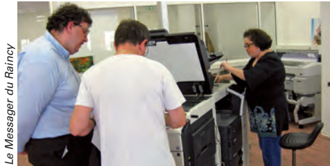
Le Messager du Raincy