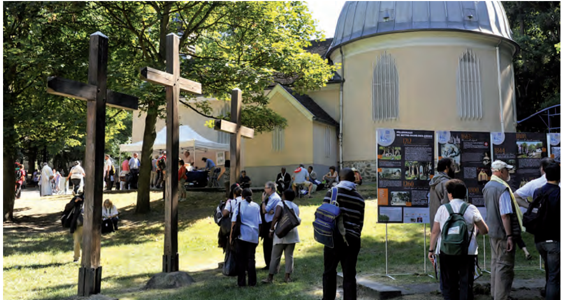
800 ans du pèlerinage à Notre-Dame des Anges de Clichy-sous-Bois en 2012.