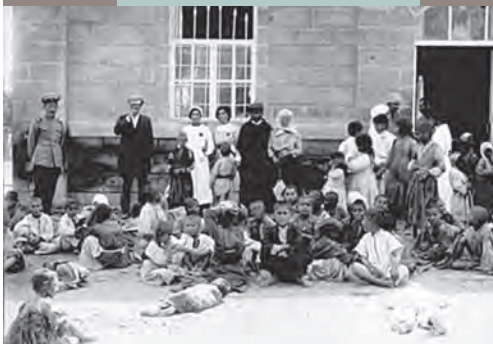
Musée-institut du génocide arménien