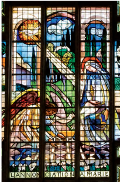
Le Messager du Raincy