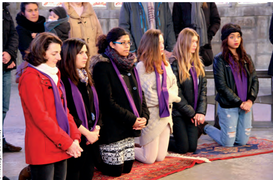
le messager du Raincy