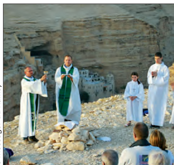
le messager du Raincy

Un pèlerinage en Terre Sainte est organisé du 20 au 27 octobre 2015 (vacances de la Toussaint). Pour vous inscrire, vous pouvez vous rendre au presbytère de la paroisse, 40, allée du jardin anglais, aux heures d'accueil (voir « infos pratiques » page 2). C'est le père Frédéric Benoist qui accompagnera le groupe. Le coût estimé est de 1 600 € par adulte et 900 € par enfant.