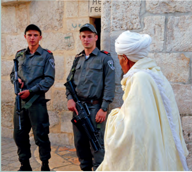
l'écho de Villemomble