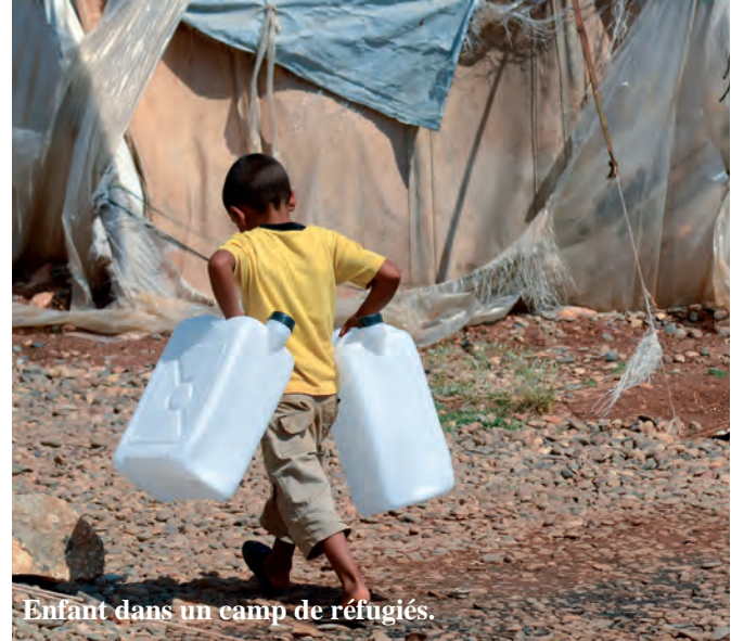
Enfant dans un camp de réfugiés.

« Seigneur rassemble nous dans la paix de ton amour. » C'est d'un même cœur que les fidèles catholiques, protestants et syriaques ont prié avec les Pères Benoist et Boucher, le Pasteur Wüthrich et le Père syriaque Aydin lors de la célébration œcuménique au temple du Raincy. 935 € ont été collectés et remis à l'Ordre de Malte qui œuvre auprès des chrétiens d'Orient.