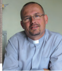
Par le Père Frédéric Benoist, curé du Raincy