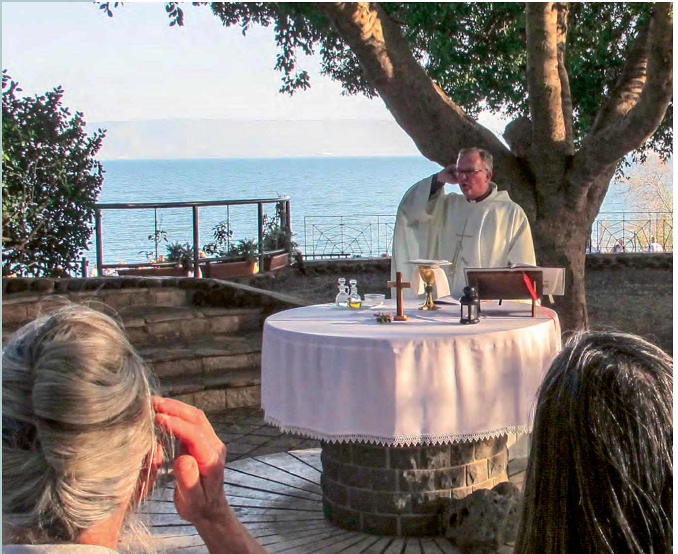
l'écho de Villemomble

Nous savons que notre véritable patrie n'est pas ce monde, mais le Royaume de Dieu qui grandit. Ainsi, en quittant notre pays pour la Terre Sainte, nous faisons bien plus qu'un voyage touristique. Nous voulons rompre avec une vie installée pour partir, comme Abraham, dans ces lieux où Dieu s'est révélé depuis l'antique Patriarche jusqu'aux Apôtres qui ont commencé d'annoncer l'Évangile. Israël, les territoires palestiniens, une partie de la Jordanie, du Liban et de l'Égypte sont le cadre géographique qui donne une occasion unique de connaître la Bible de manière naturelle en évoquant les épisodes les plus marquants au travers des lieux où ils se sont déroulés. Nous savons que les Juifs de la diaspora (en Égypte ou en Mésopotamie) ont commencé à venir à Jérusalem pour les grandes fêtes depuis leur première dispersion au VI e siècle avant J.-C. Cette tradition perdue encore aujourd'hui. L'insistance sur la direction de la prière vers Jérusalem avant que celle-ci n'ait été changée, montre aussi le caractère sacré de cette ville aux yeux des musulmans.