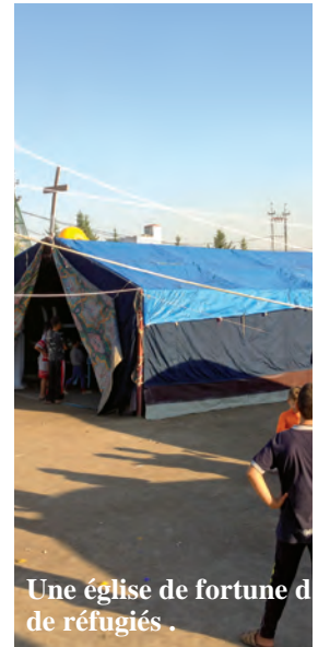
Une église de fortune de réfugiés.