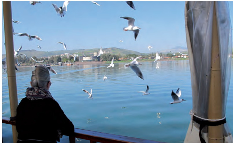
l'écho de Villemomble

Ça fait deux jours que je suis rentrée et la messe quotidienne me manque; mes pieds sont ici à Pavillon, mon âme est restée à Jérusalem; dans ce groupe de pèlerins, j'ai découvert le caractère unique de chacun: son histoire, ses souffrances, ses talents.