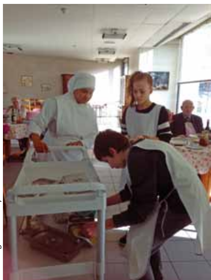
le messager du Raincy