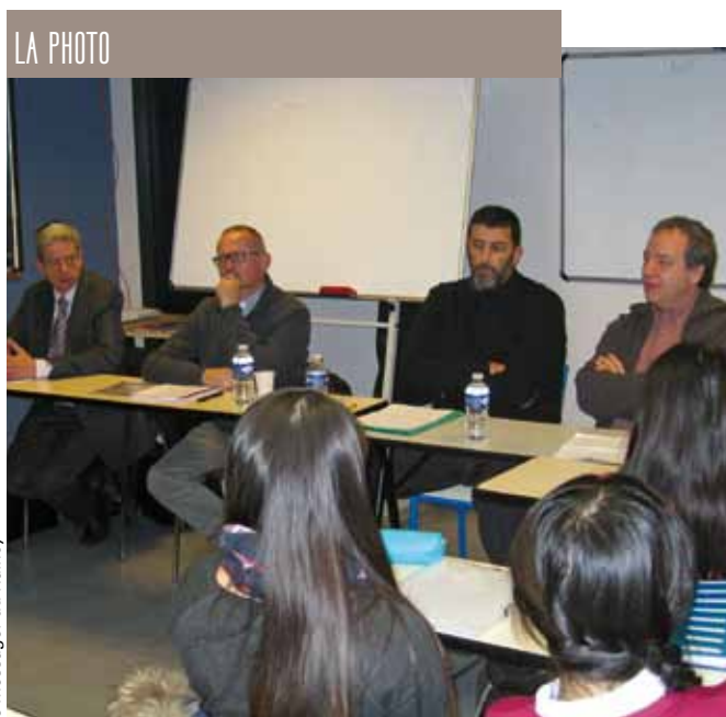
le messager du Raincy