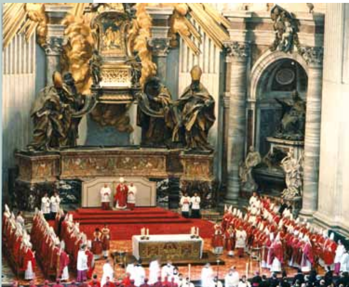
Cérémonie d'ouverture d'un synode à Rome, en 1990.