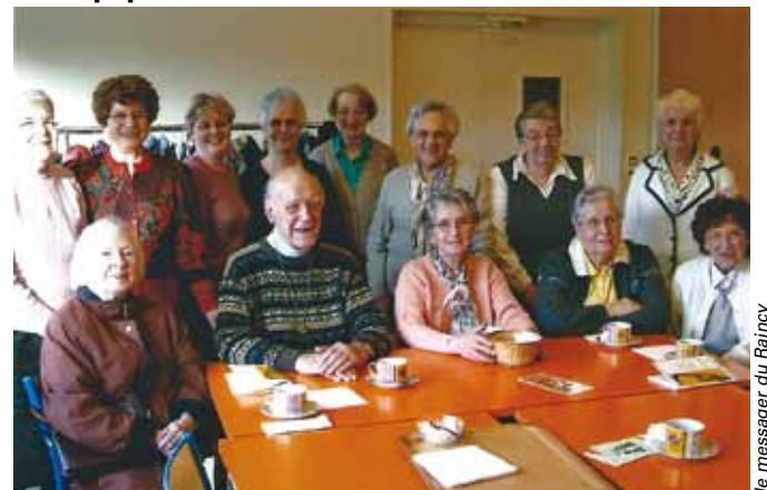
le messager du Raincy