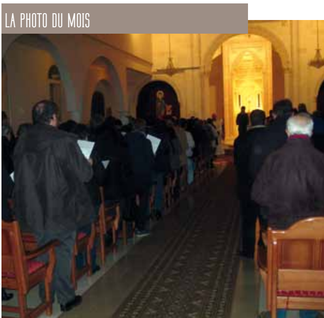
LA PHOTO DU MOIS

Célébration œcuménique entre les communautés catholique, protestante et orthodoxe syriaque du vendredi 24 janvier 2014 à l'église syriaque de Montfermeil dans le cadre de la Semaine de prière pour l'unité des chrétiens.