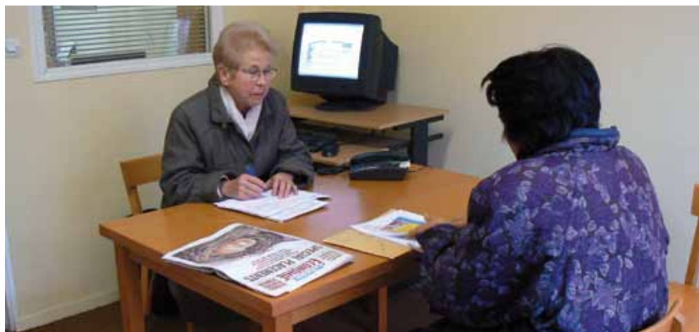
L'Écho de Villemomble

entretiens réguliers et par son réseau de relations pour les démarches, lettres de motivation, préparations aux entretiens... La personne suivie effectue ses recherches par elle-même, en s'appuyant sur