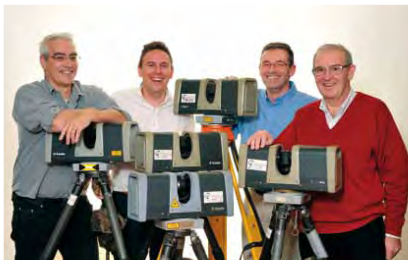
l'Echo de Villemonble

Une équipe qui joue la confiance, la lucidité et la ténacité.