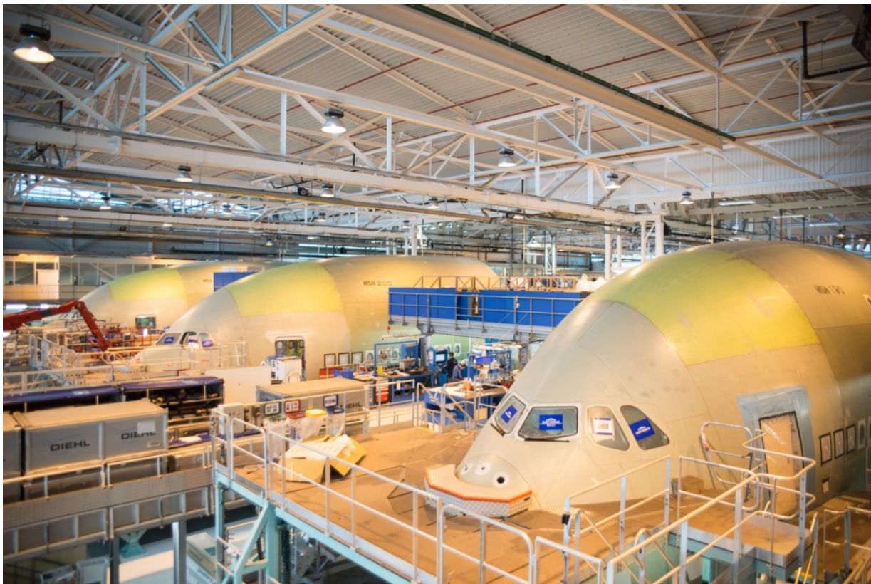
Chaîne de production AIRBUS