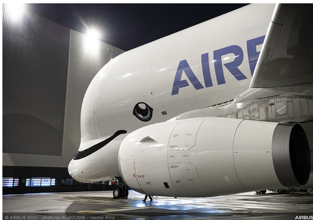
Airbus Beluga XL